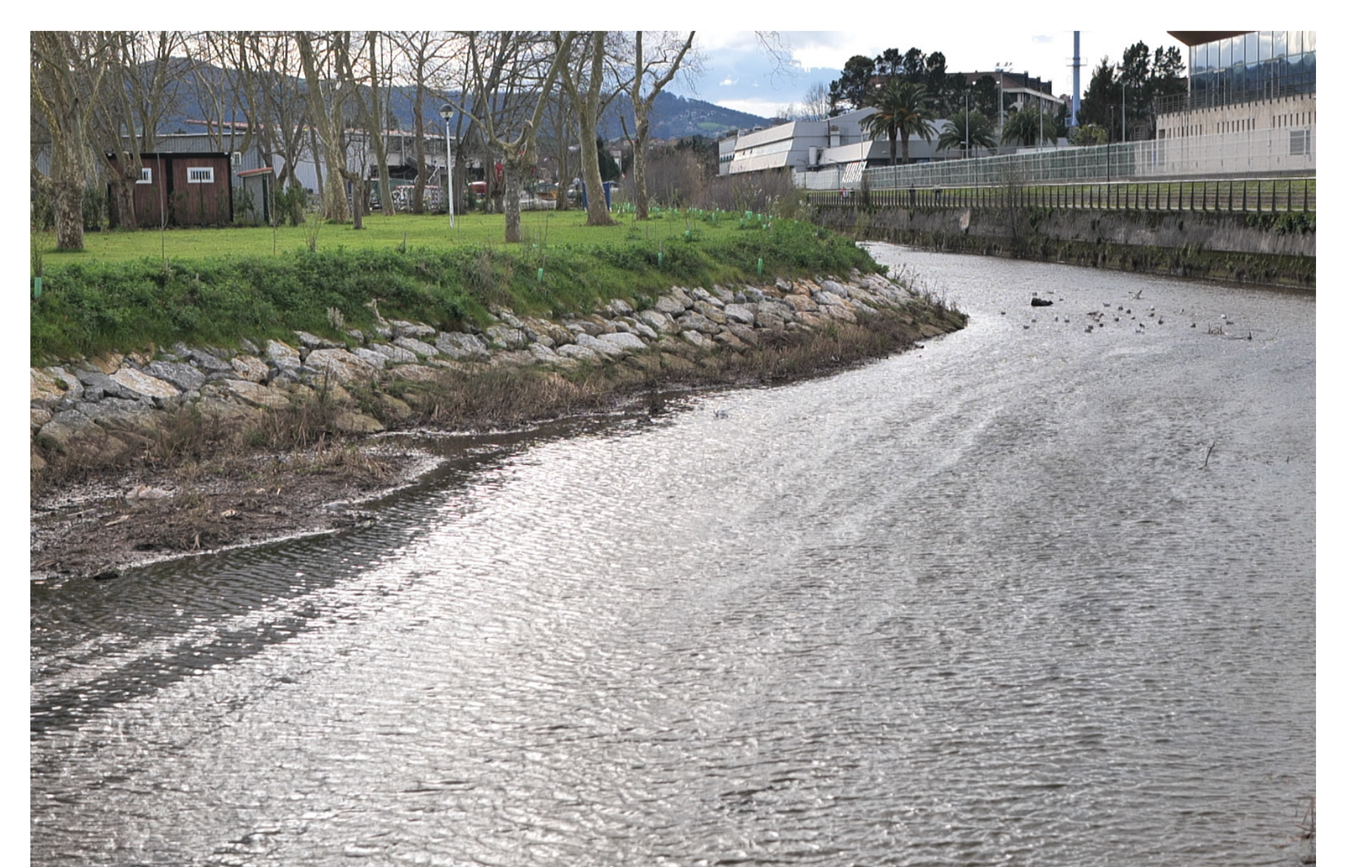
Cauce renaturalizado del río Piles, obra ejecutada como parte del proyecto Piles Natural.