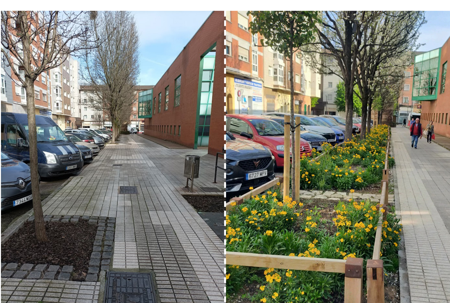
Implementación del sistema Estocolmo en la calle Alejandro Farnesio. Antes y después.

El proyecto Piles Natural ha permitido la recuperación del tramo bajo del río Piles y el Peñafrancia, un cauce previamente canalizado y afectado por episodios de contaminación. La intervención ha eliminado barreras, restablecido la continuidad fluvial y revegetado las riberas. Los resultados han sido visibles: mejora de la calidad del agua, ausencia de cierres por contaminación en la playa de San Lorenzo y regreso de especies como el martín pescador, la garceta, la garza real y el mirlo acuático.