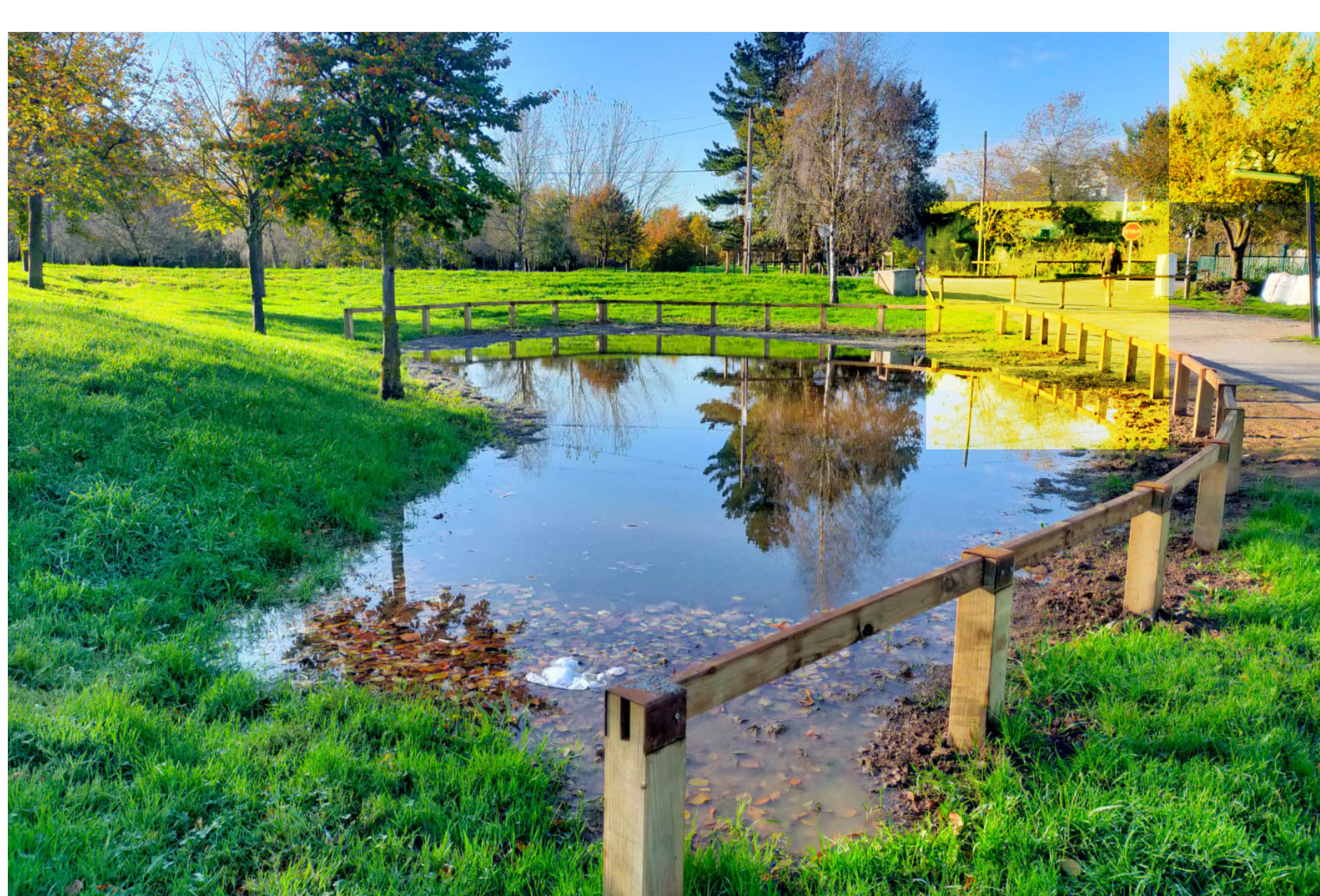
Jardín de lluvia tipo laguna de biorretención. Parque Fluvial. Viesques.